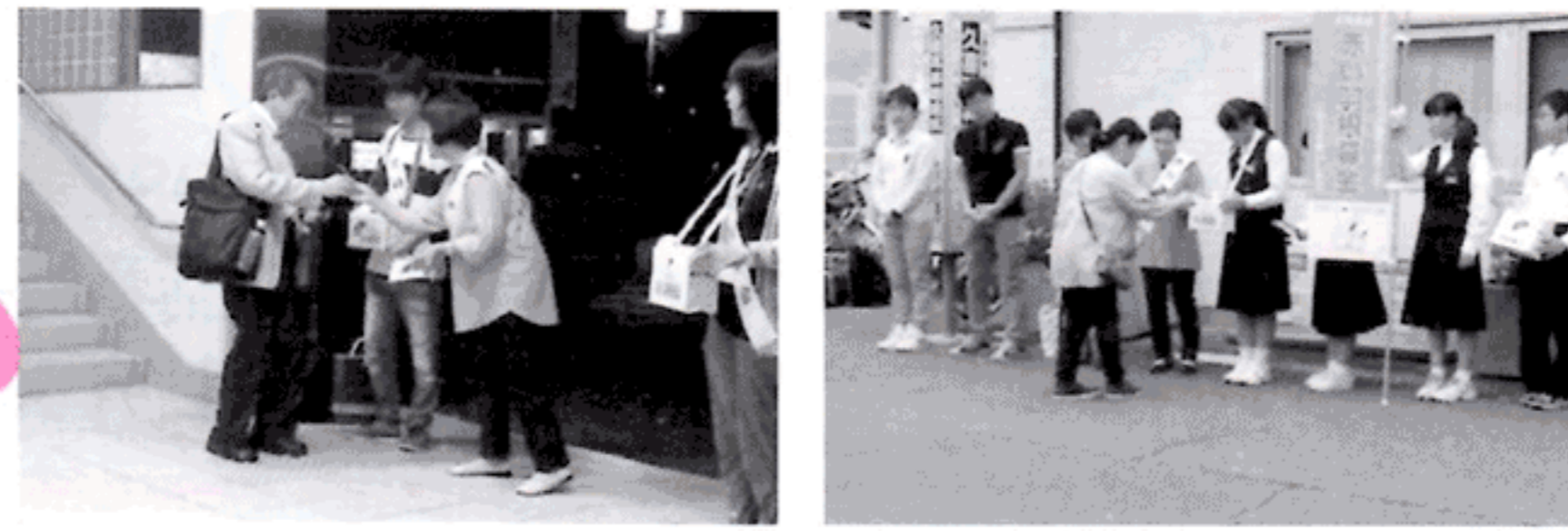
共同募金会宮代支会 平成28年度一般募金実績

平成28年度赤い羽根共同募金運動が10月1日より行なわれました。行政区長及び班長、宮代町民生委員・児童委員協議会、日本工業大学学園際実行委員会、役場職員、町内福祉団体の方、そして町民の皆様のご協力によりたくさんの募金が寄せられました。有難うございました。金額は次のとおりです。