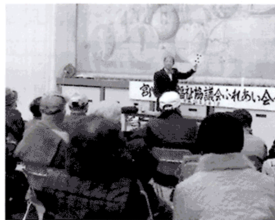
トーク&マジックショー