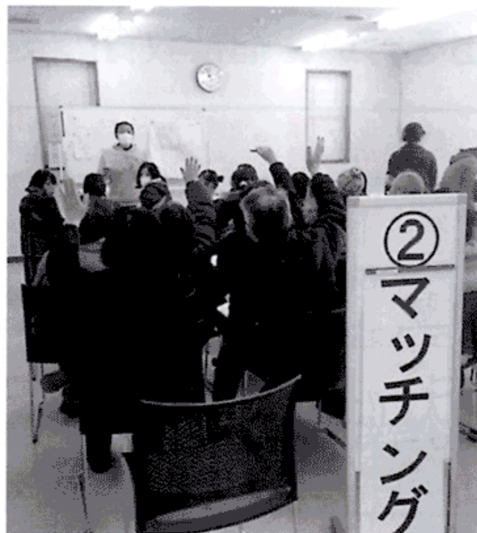
ニーズとボランティアを マッチングさせています。

宮代町赤十字奉仕団の共催で、1月28日（土）宮代町社会福祉協議会にて、災害ボランティアセンターの立ち上げ訓練を行いました。