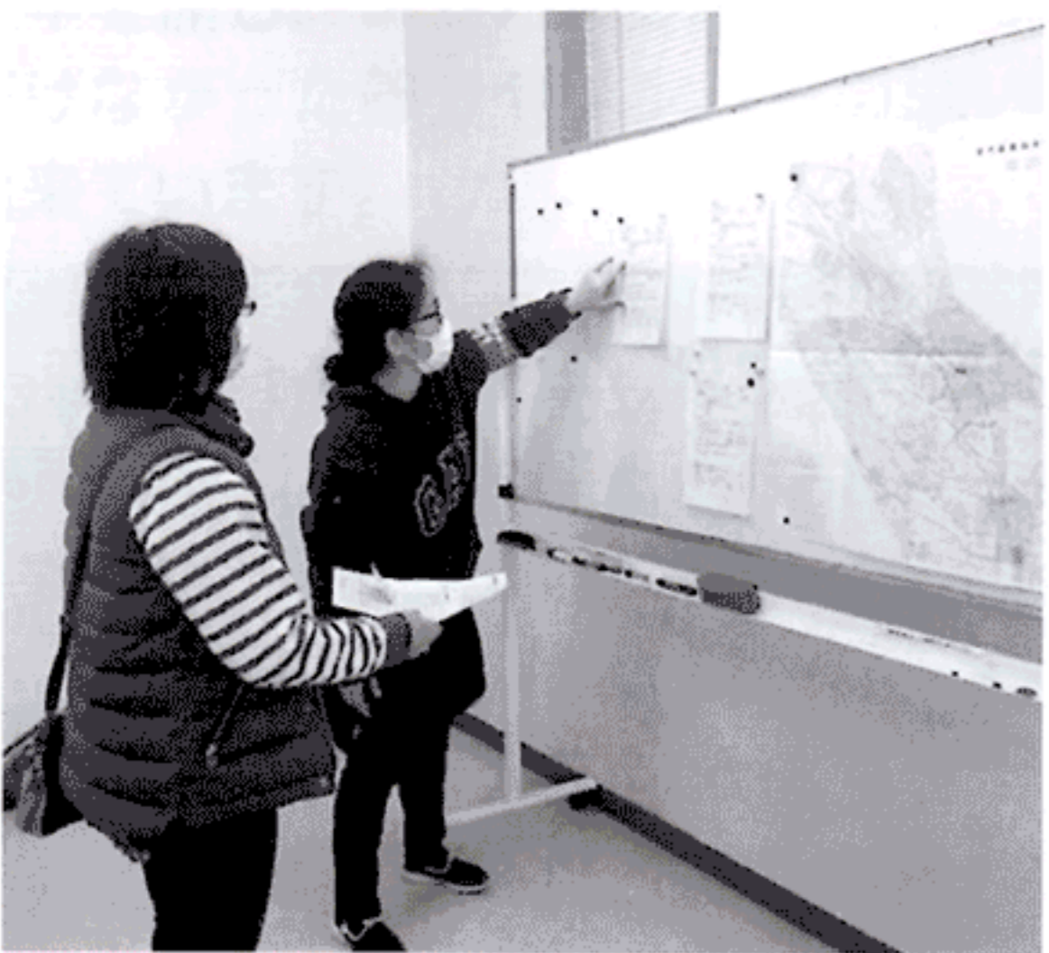
ボランティアに場所を丁寧に 説明をしています。