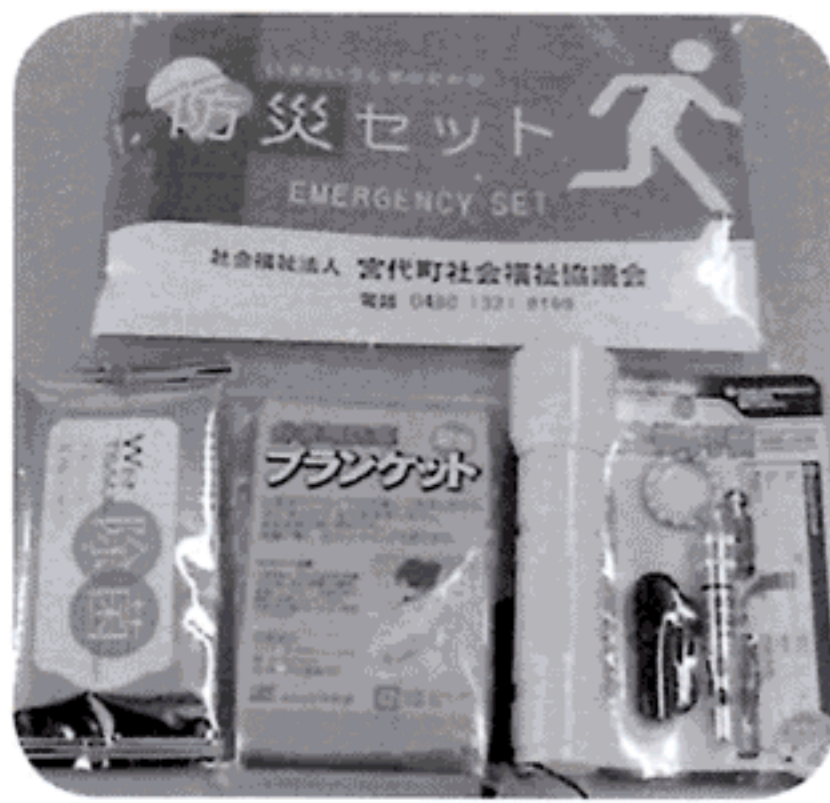
歳末慰問品で配布しました！