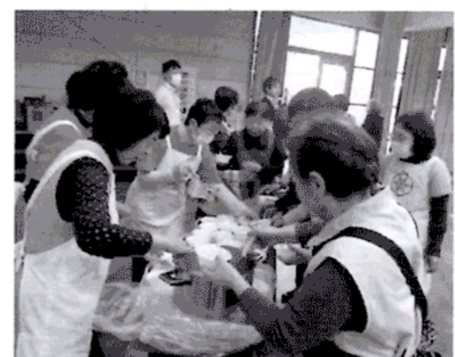
食生活改善推進員協議会の皆さん