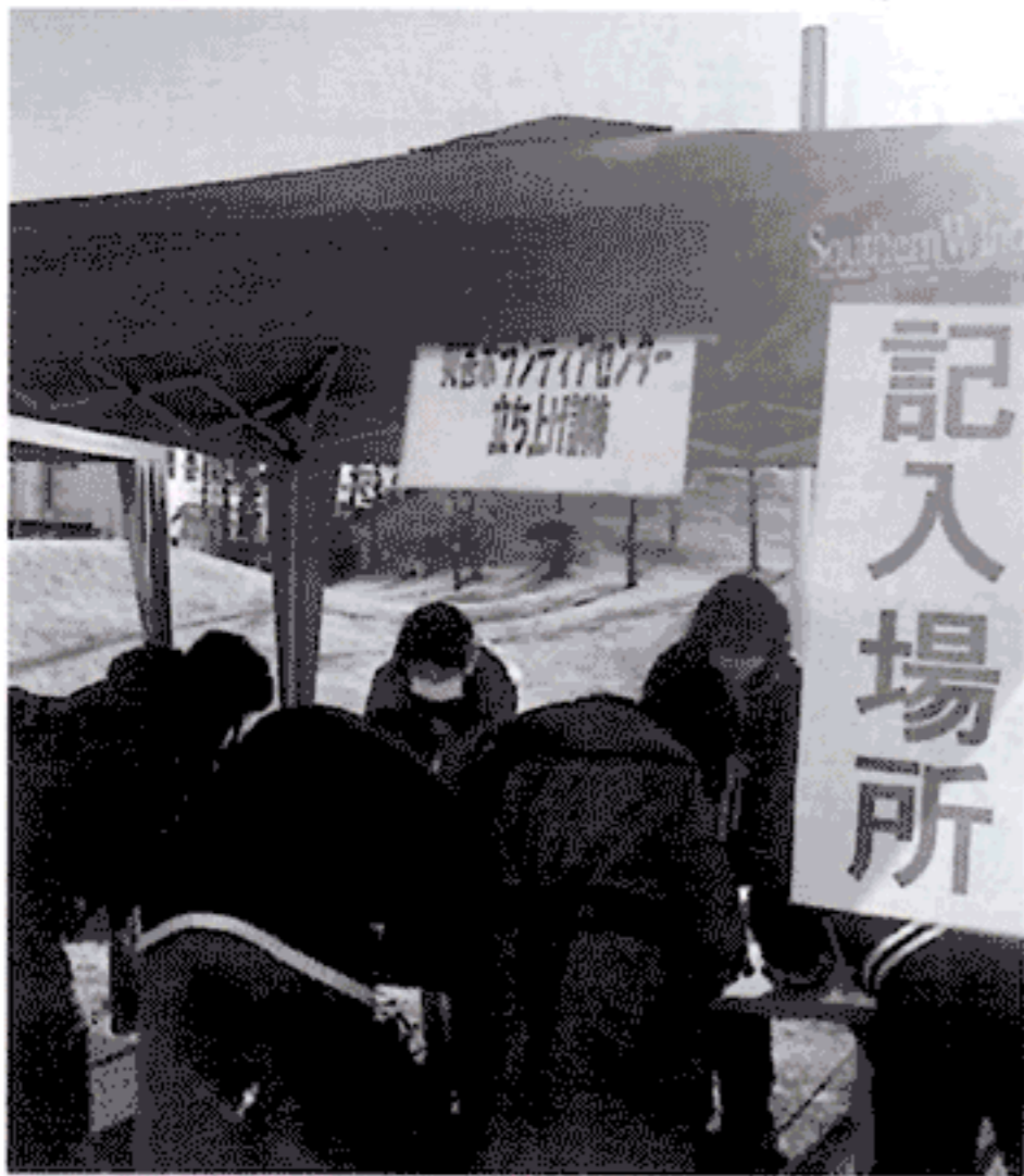
受付で自分の情報を記入。 さあ、ボランティアやるぞ！