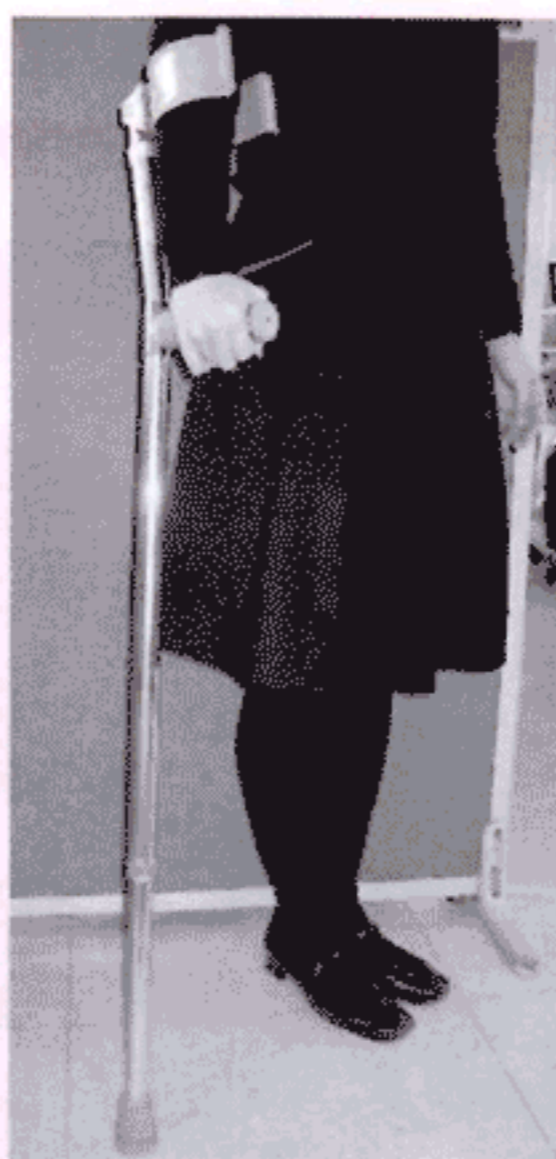
ロフトランドクラッチ