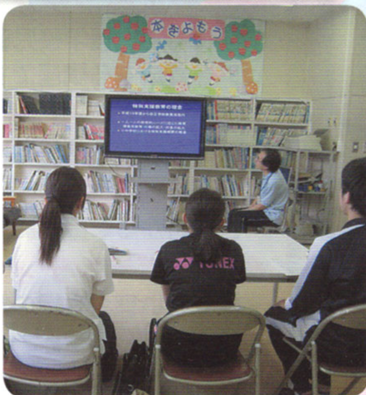
各種ボランティア養成講座開催