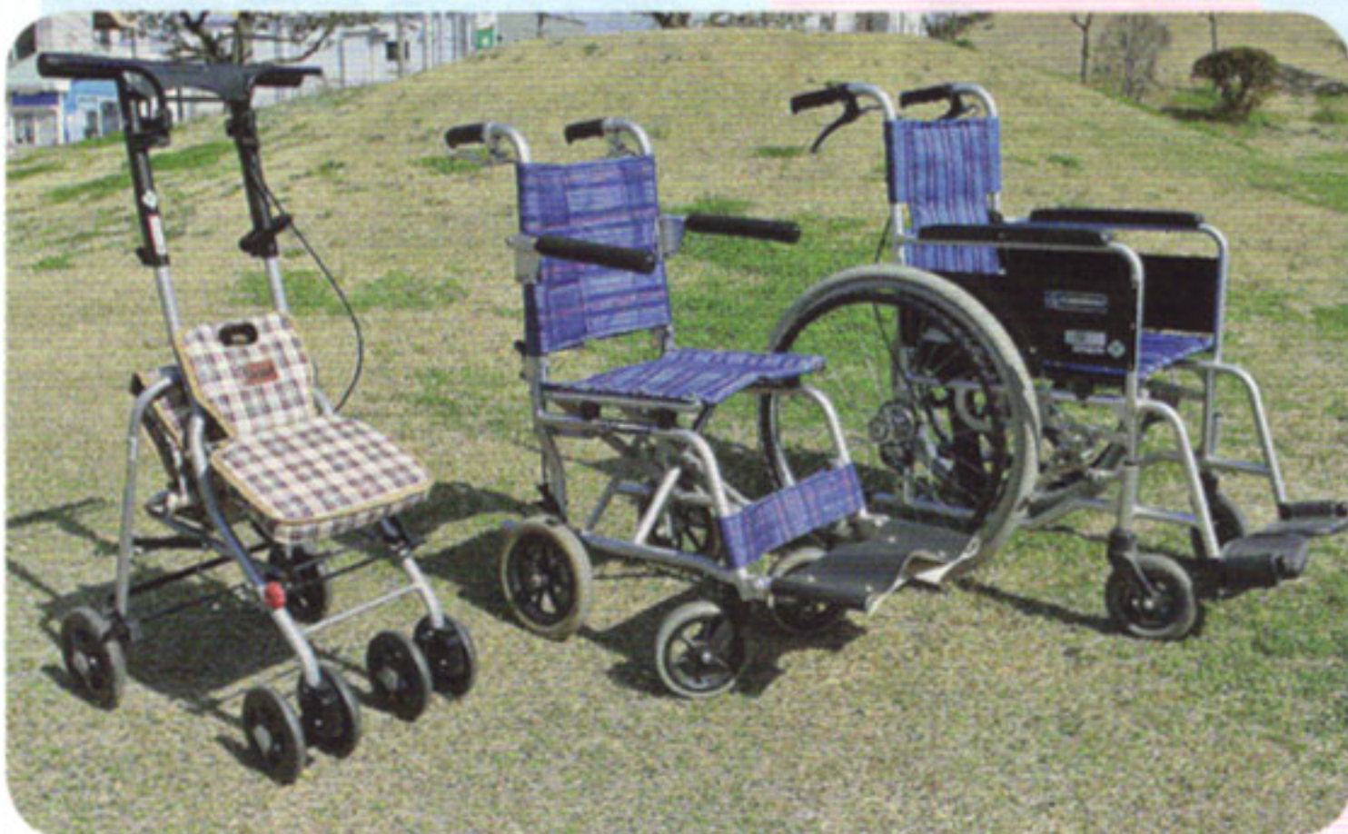
車いすの無料短期貸出