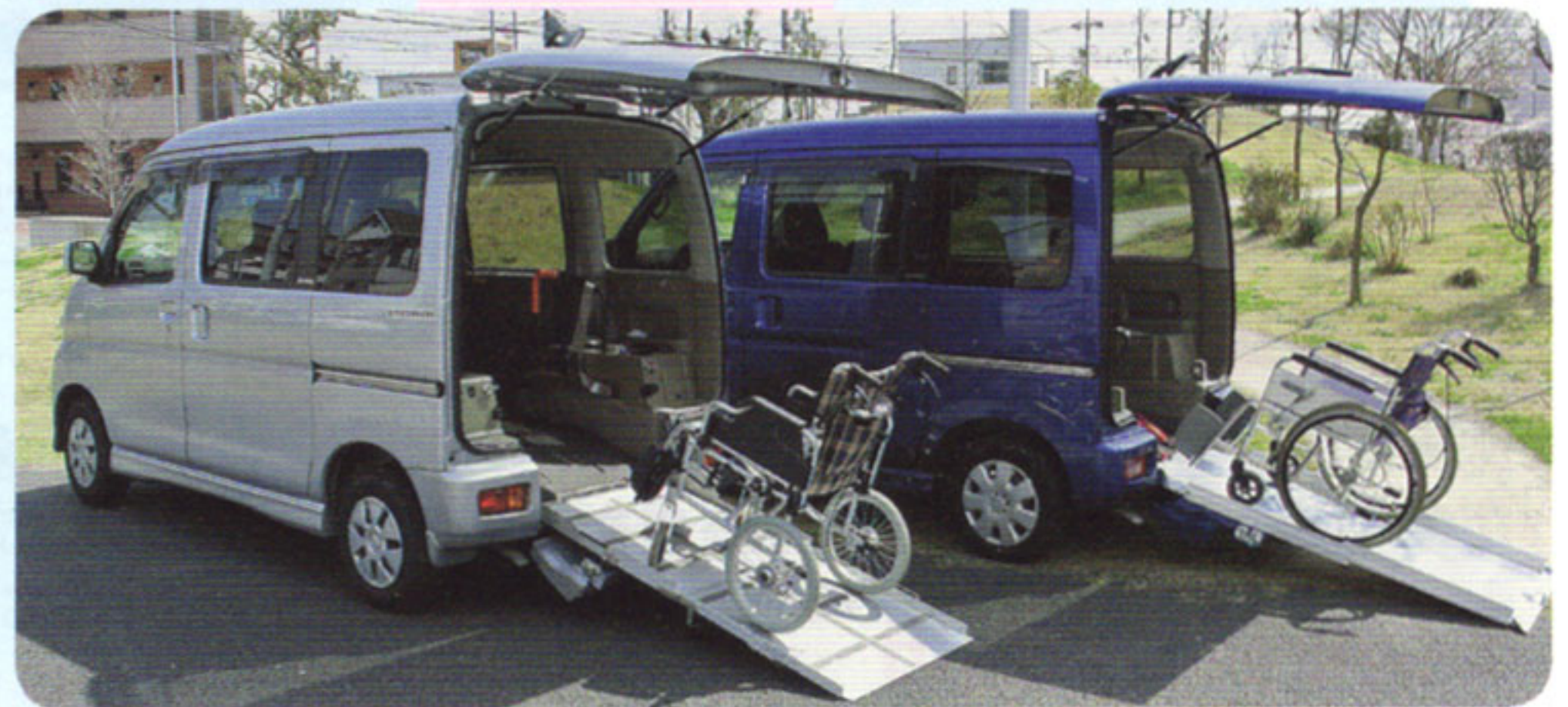
車いすのまま乗り込める福祉車両の貸出 (1km10円)