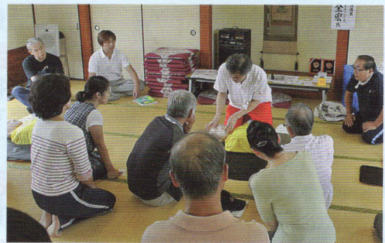
自主防災会での心臓マッサージ・人工 呼吸・AEDの講習会をお手伝いします。