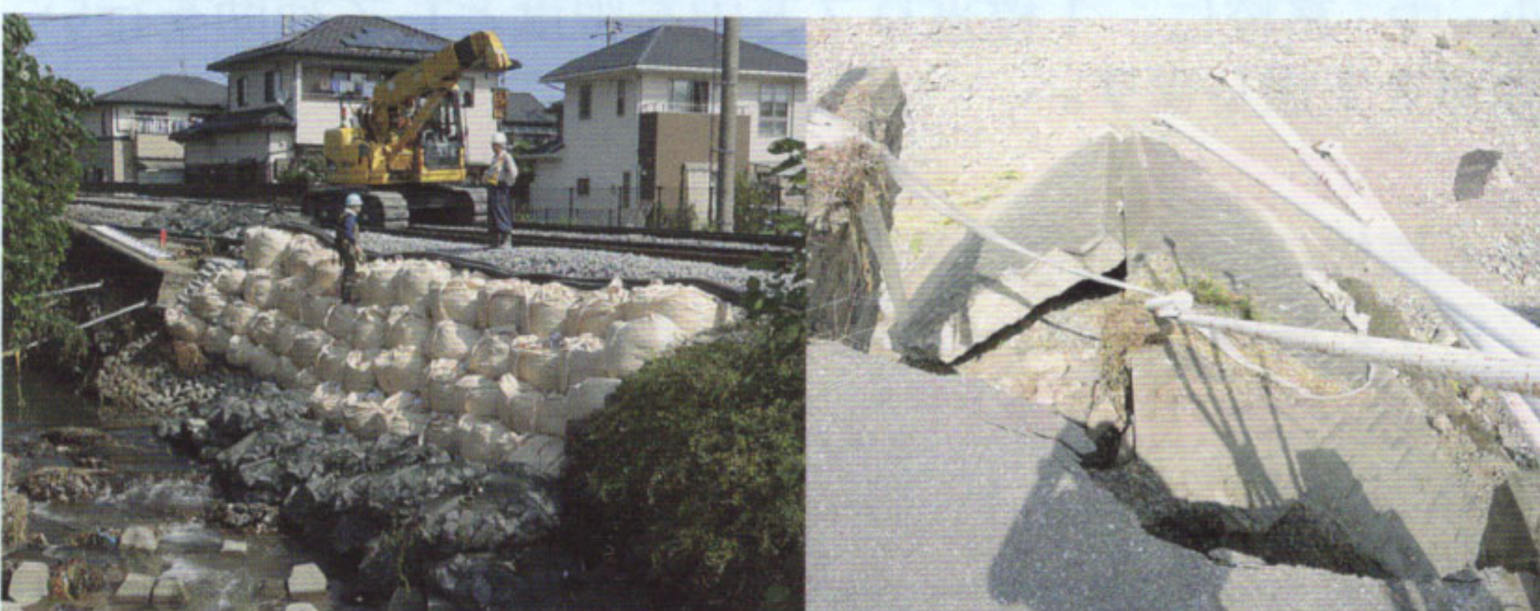
災害ボランティアセンターのお手伝い（写真は栃木県）