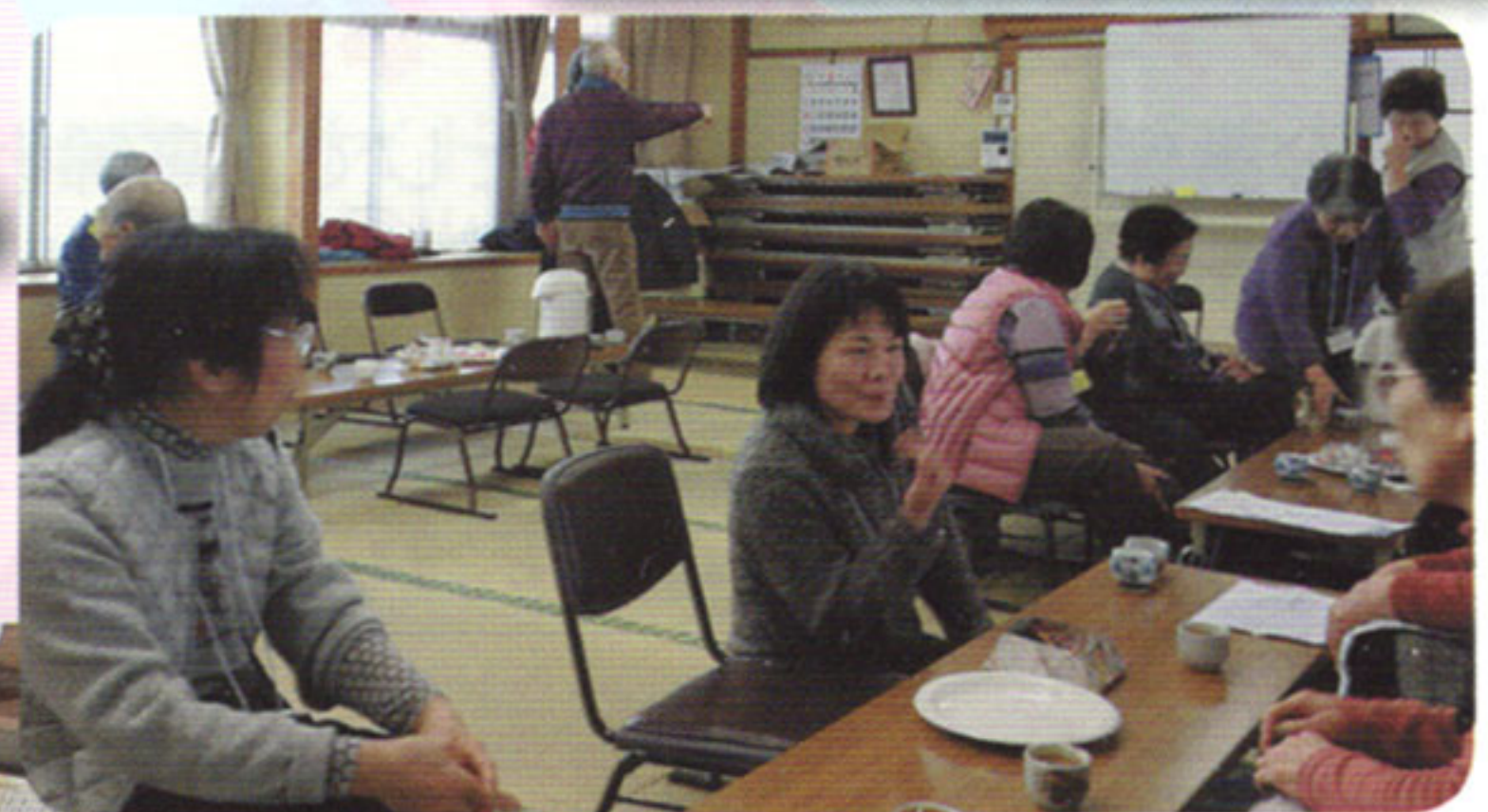
▲交流サロンどんぐり