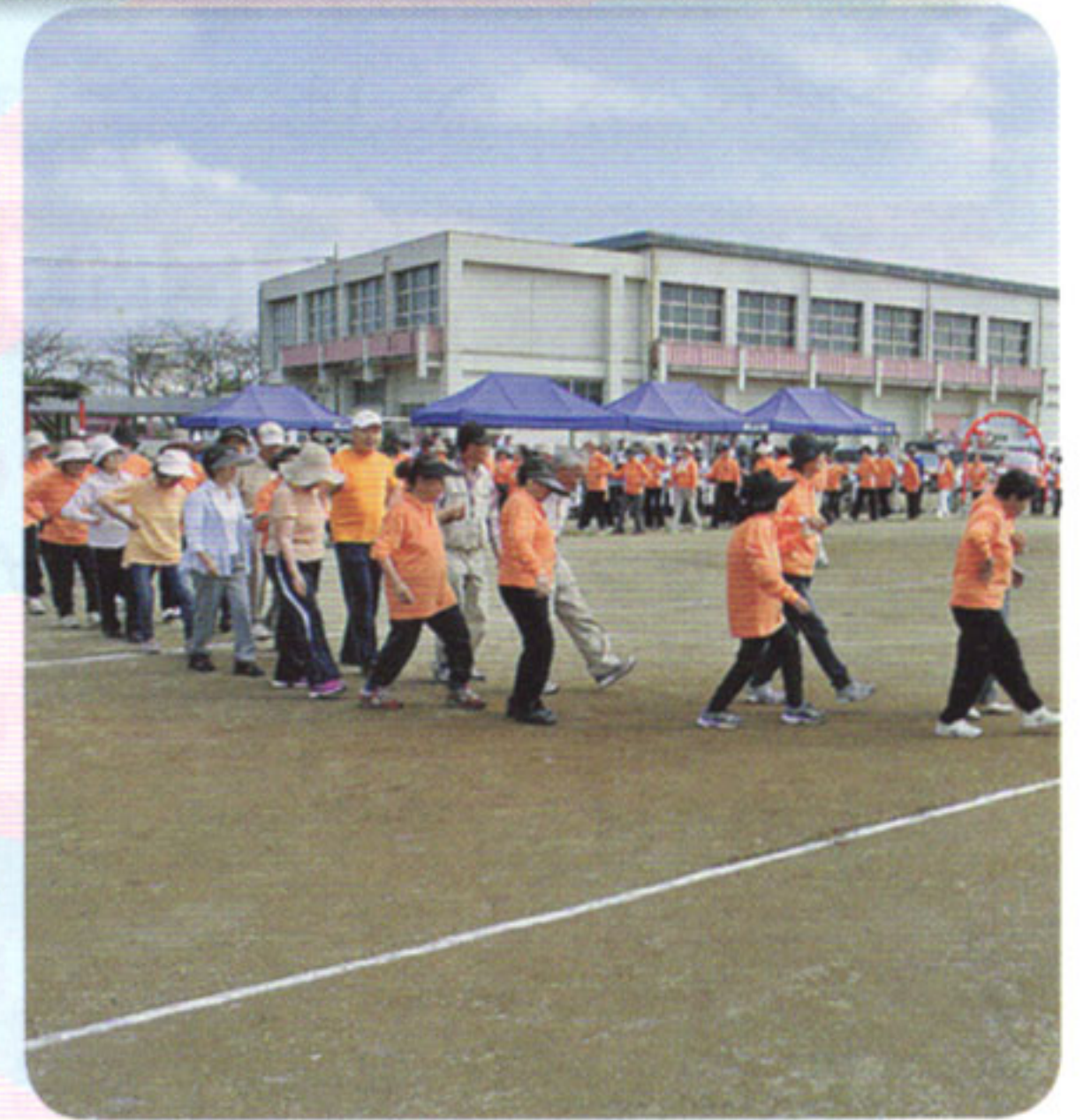
福祉運動会の開催