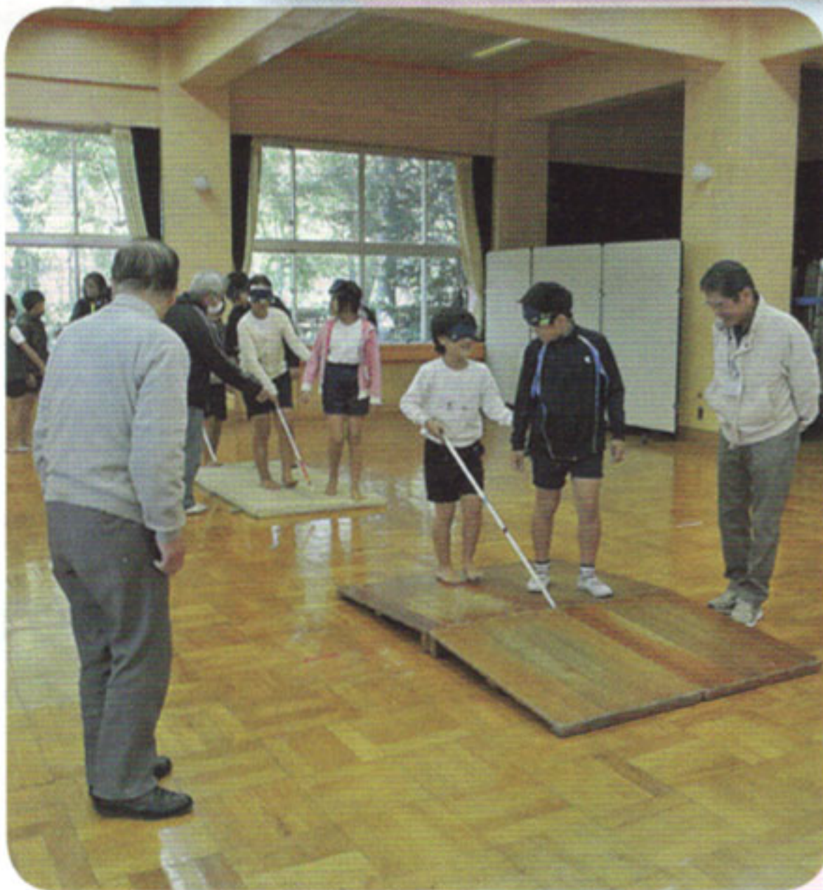
福祉教育(町内の小・中学校)の支援