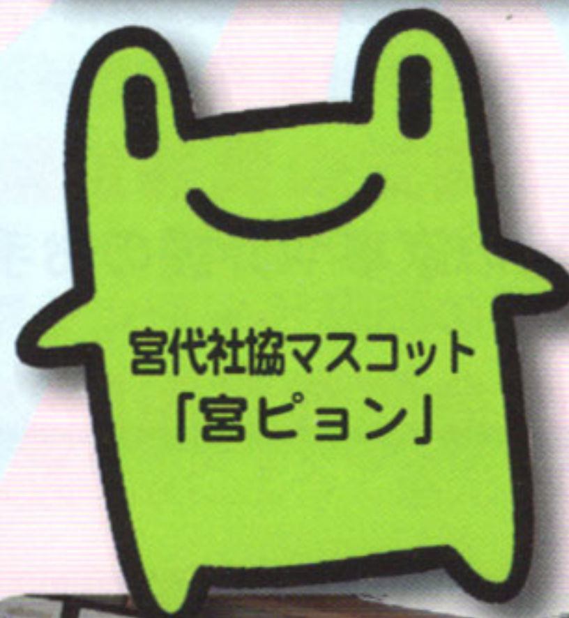
宮代社協マスコット 「宮ピョン」