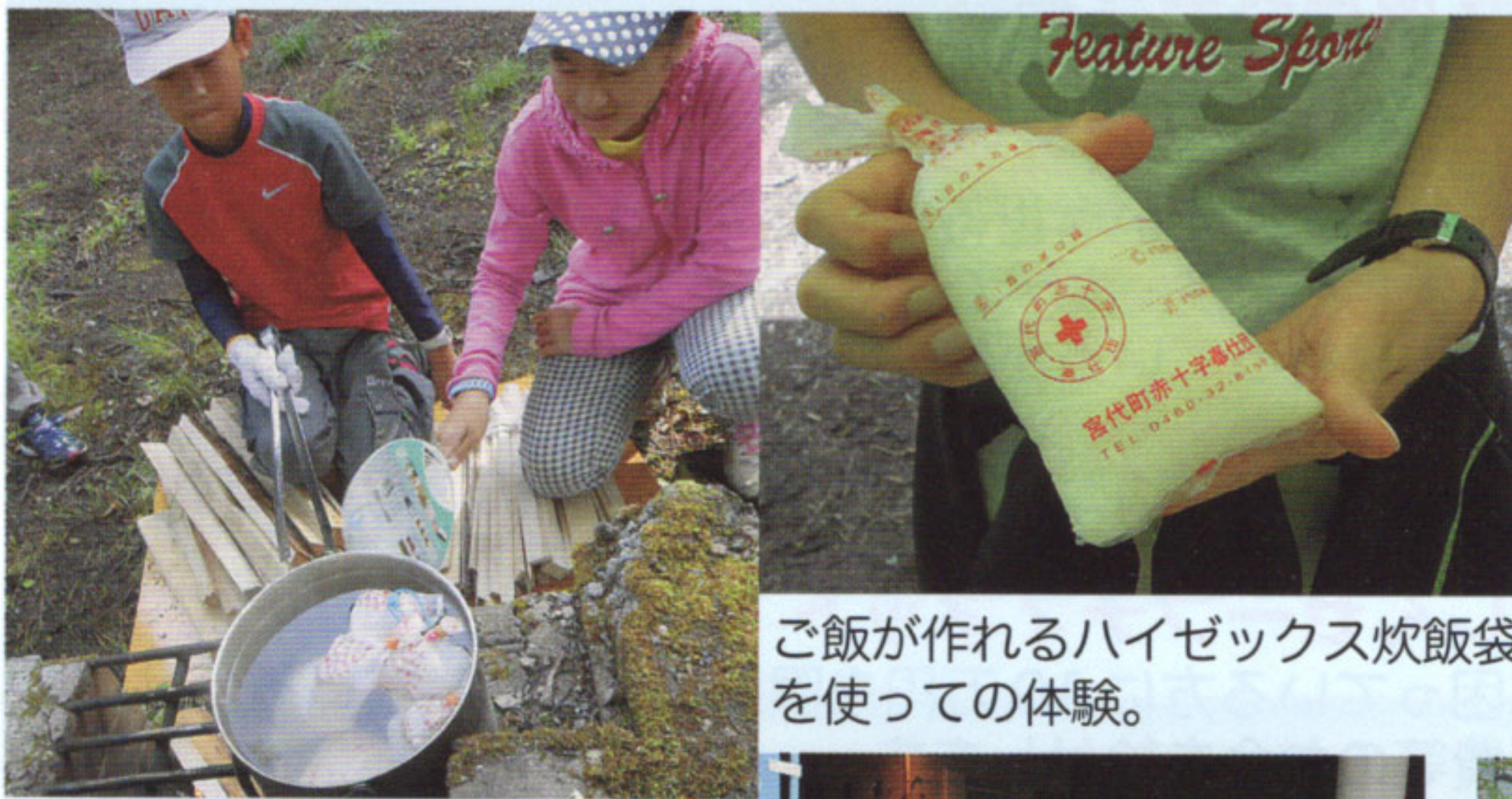
ご飯が作れるハイゼックス炊飯袋 を使っての体験。