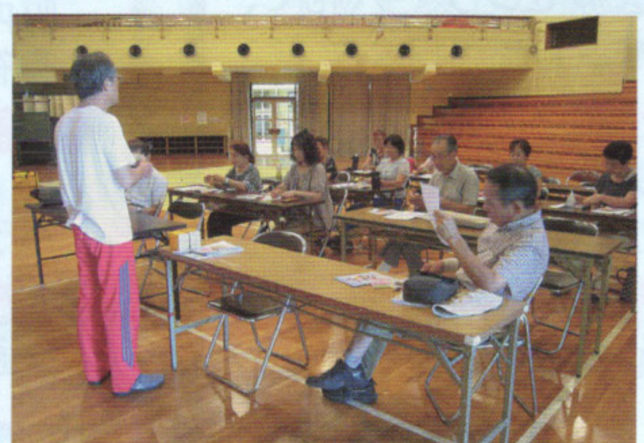
日赤奉仕団講習会