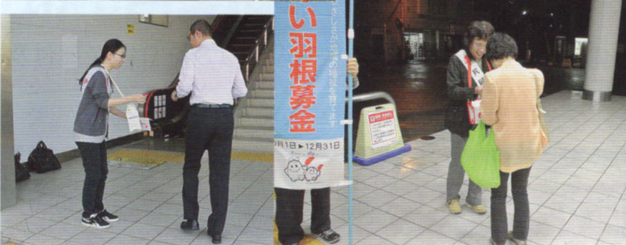
赤い羽根共同募金