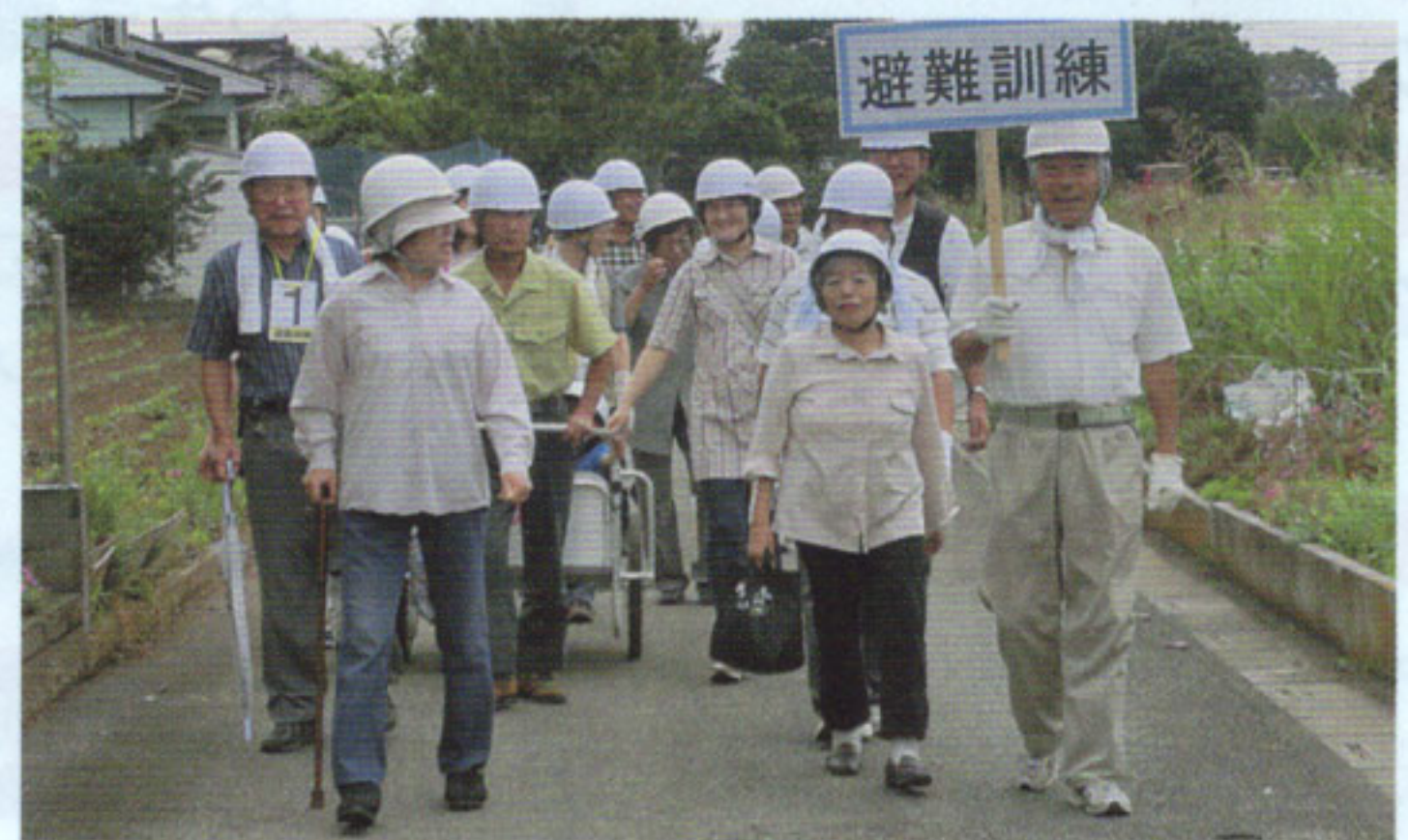
自主防災会の避難訓練の様子