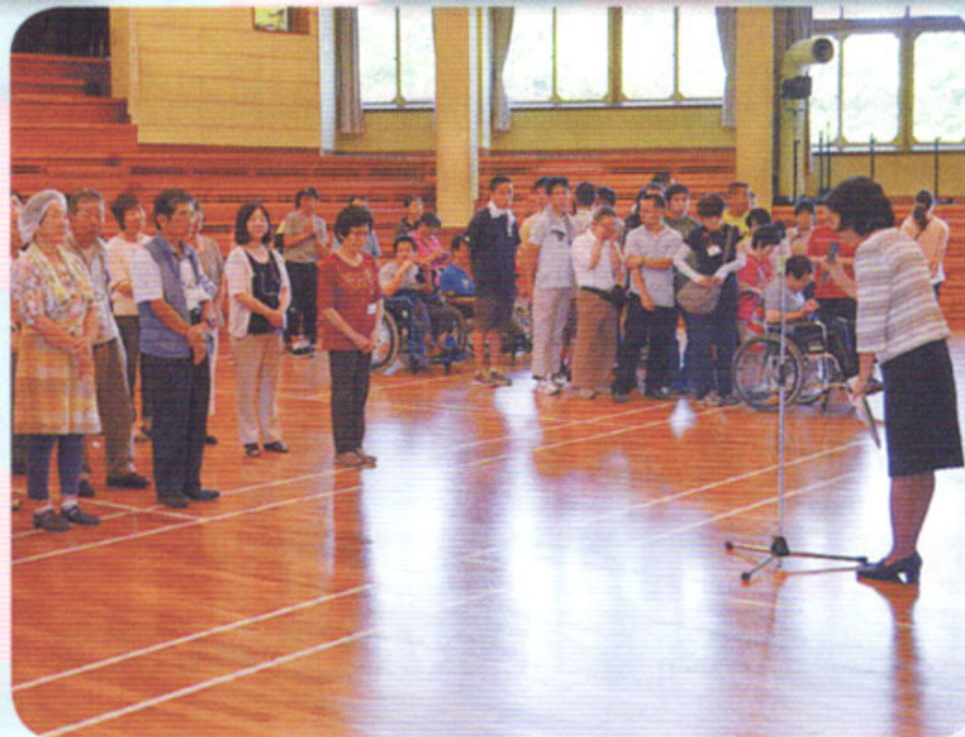
ボランティア団体への支援