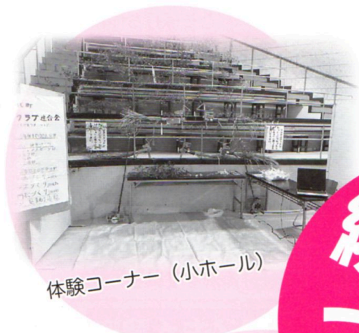
体験コーナー (小ホール)

来年も、多くの地域住民の皆さんに参加していただき、繋がっていただければと思います。きっと、一歩踏み出すことが参加となり、そのことが、新しいご縁につながります。そのご縁が、また新しい経験や、学びへ繋がり、今までのご自身の人生になかった世界が広がるのだと思います。