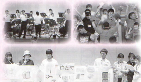
サクスコンサート