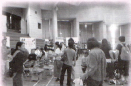
ボランティア団体体験・紹介ブース