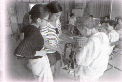
旭クラブ (地域交流サロン) で小物作り体験