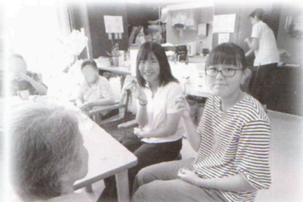
介護老人保健施設はーとびあ