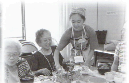
お喋りサロン学園台