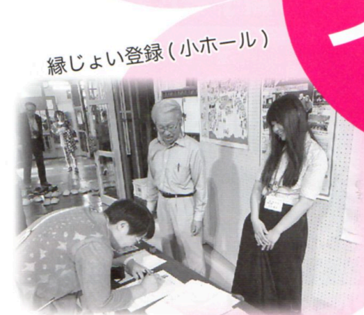
縁じよい登録 (小ホール)