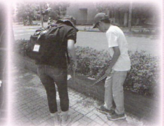
ふれんだむ ストリート清掃