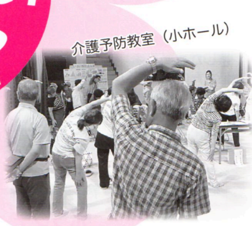
介護予防教室 (小ホール)