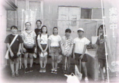
MIYASHIRO エコ☆スターズ とゴミ拾い体験