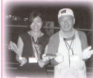
みどりの森 納涼祭