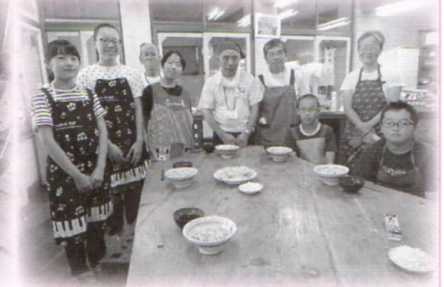
みやしる団世会 とそば打ち体験