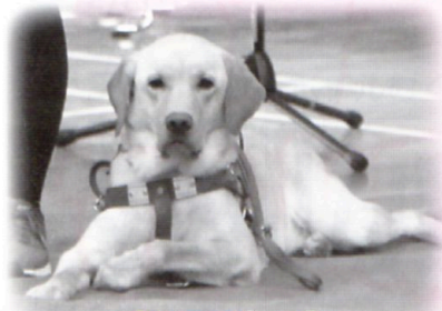
【今年のゲスト】 アイメイト(盲導犬)

7月7日(土)進修館にて、ボランティアグループの活動紹介&体験、模擬店、コンサート、スタンプラリーなどなど！盛りだくさんのお祭りを行いました。