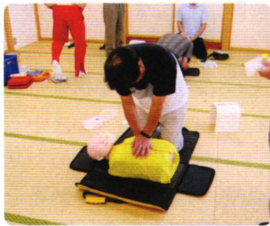
心肺蘇生法の講習

心配蘇生法・AEDの使い方講習・応急手当のための講師の派遣・用具の貸し出しなどを行います。