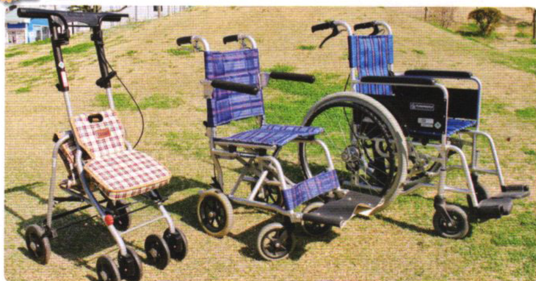
車いすの無料短期貸出