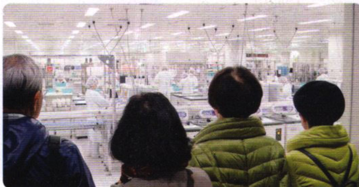
東松山の血液センター見学

主に、献血の呼びかけ、救命講習のアシスタント、赤十字の活動を知っていただくための研修旅行の企画等、さまざまな事業を展開しております。