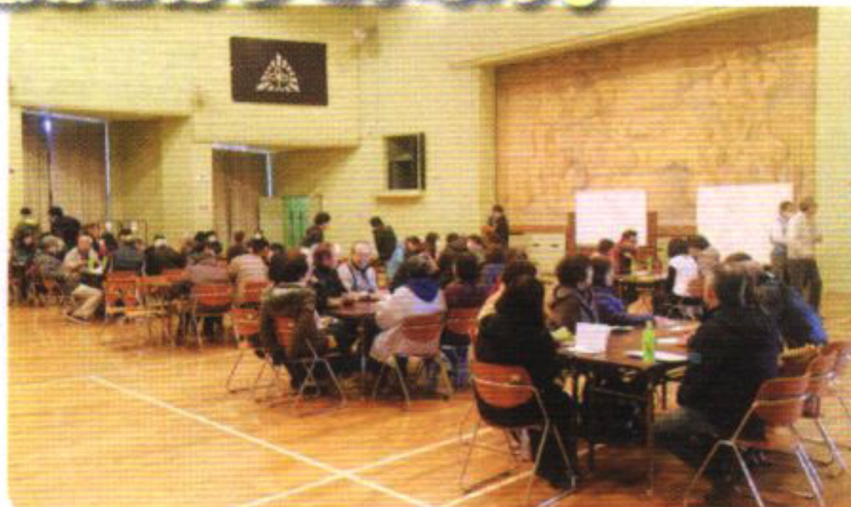
災害ボランティアセンターの受付・反省会