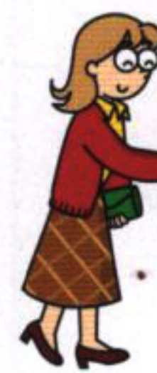
駅頭募金に民生委員や中学生も参加

自治会の皆様に納めていただいている日赤の社資は、下記の事業に大切に使用させていただいております。