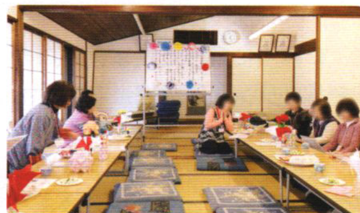
月曜の集いの様子