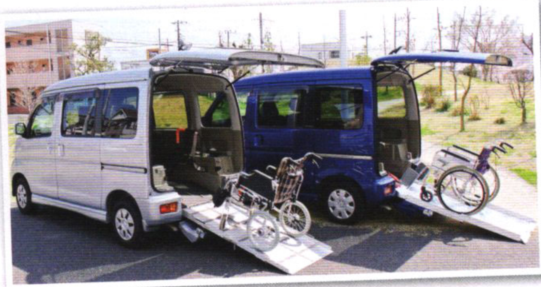
車いすのまま乗り込める福祉車両の貸出 (1 km 10 円)