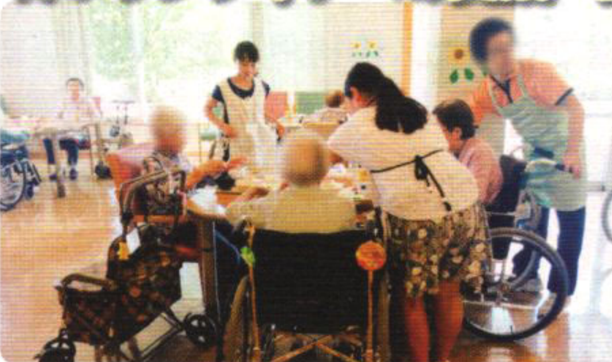
ボランティア体験