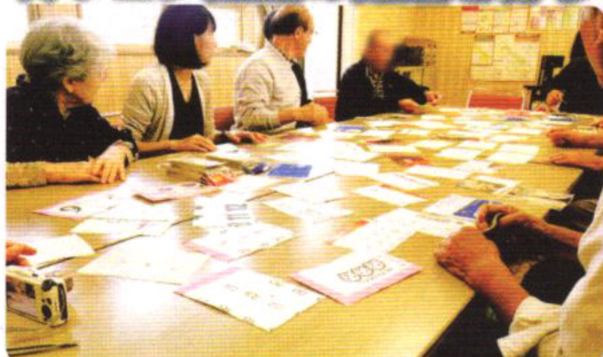
ぬくもりクラブの様子