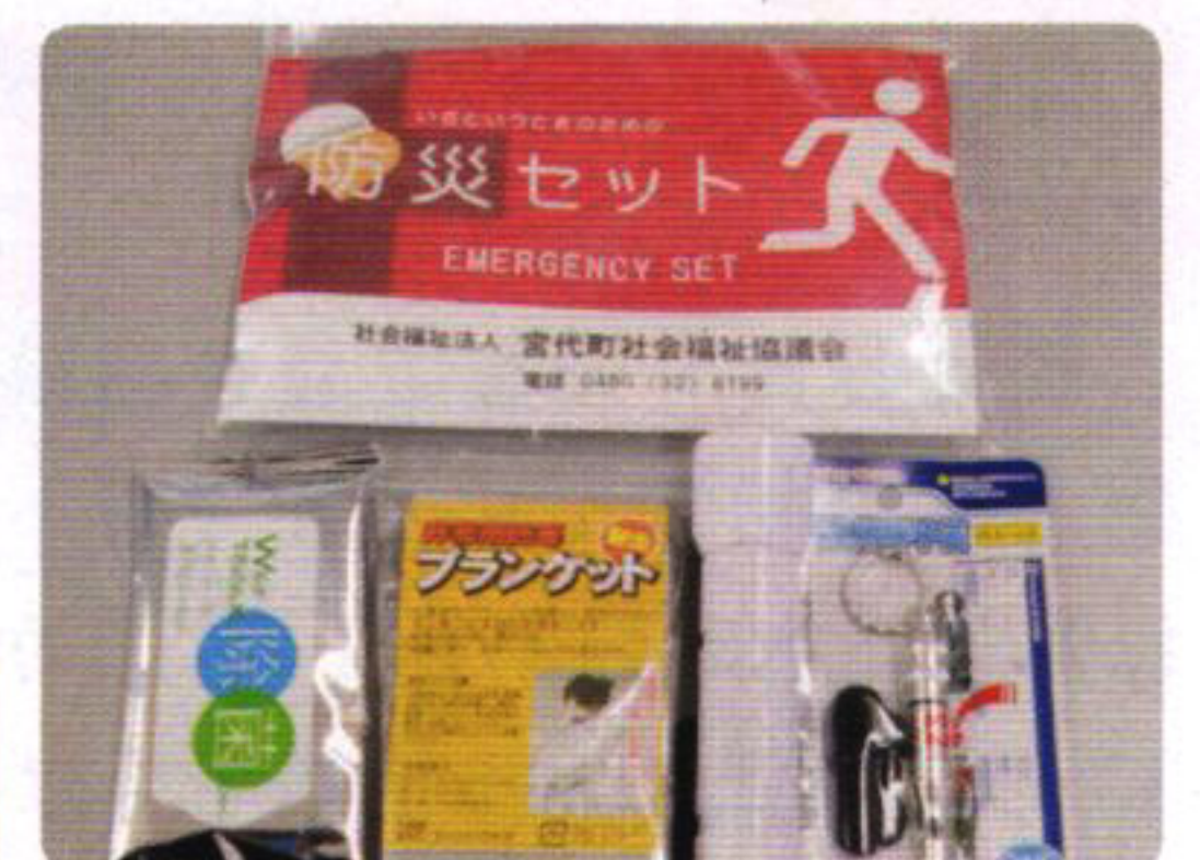
H28年度は防災セットを配付