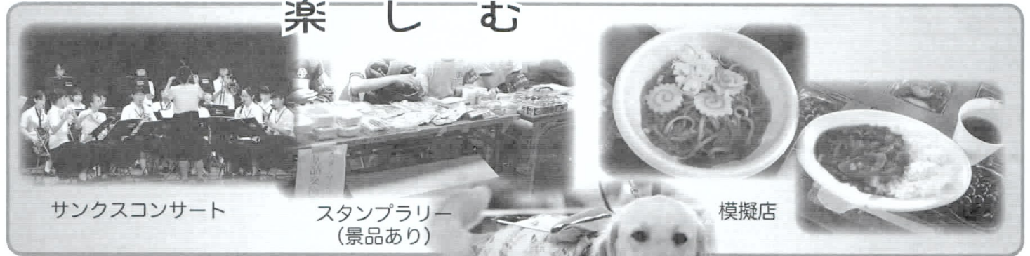
サンクスコンサート