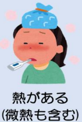
熱がある (微熱も含む)